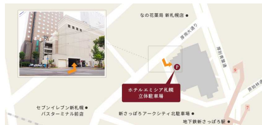
ホテルエミシア 立体駐車場 (有料)